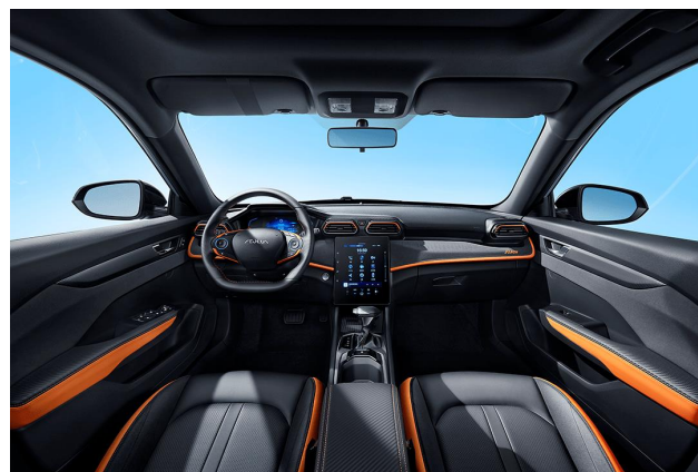
Черный с акцентными элементами оранжевого цвета

Информация, представленная на данном листе, не является публичной офертой. Содержимое спецификации составлено на основе информации о состоянии конфигурации автомобиля на момент составления данного документа. Чтобы лучше удовлетворять потребности клиентов, производитель продолжает разрабатывать и совершенствовать автомобили. Некоторые конфигурации и характеристики моделей, продаваемых на рынке, могут отличаться от этой конфигурации. Для получения более подробной информации обращайтесь к авторизованным дилерам Dongfeng в Беларуси.