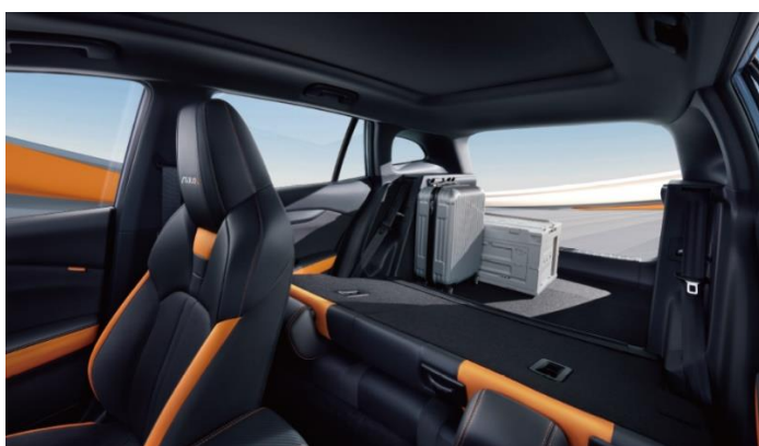
Багажник объемом 1 609 л при сложенных сиденьях 2-ряда