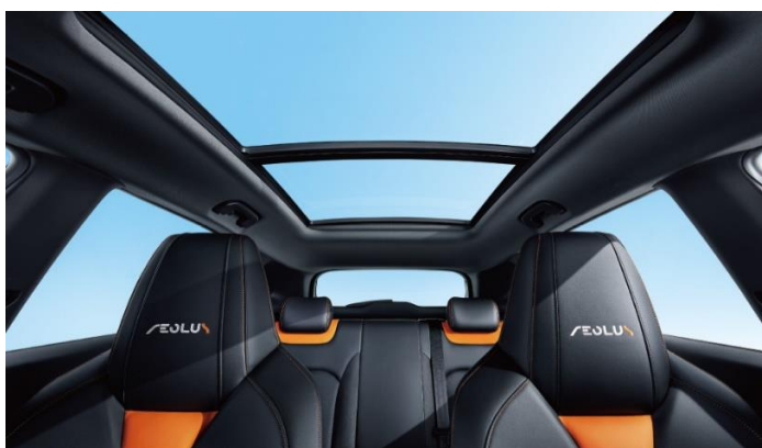
Панорамная крыша с площадью остекления 1,08 м2