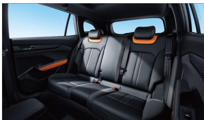
Пространство для коленей задних пассажиров 285 мм