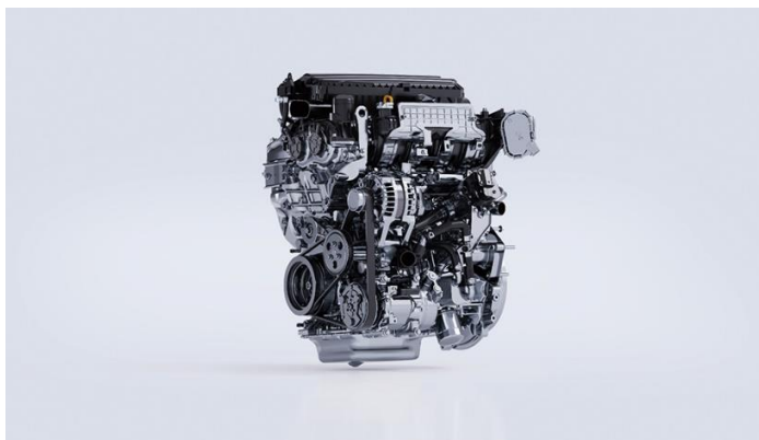
Бензиновые моторы Mach Power производства DFM-Honda