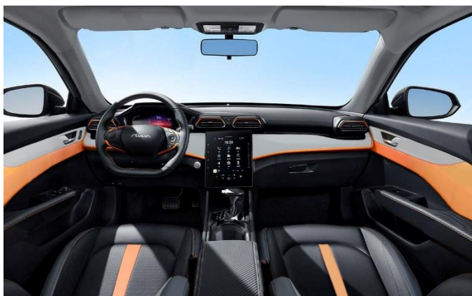
Черный с акцентными элементами серого и оранжевого цветов