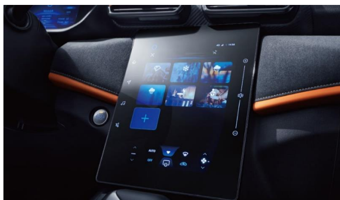
Русифицированная мультимедийная система с экраном 13,0"